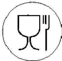
Рисунок А.1—Для пищевых продуктов

А.3 Символ и знаки, наносимые на изделия или упаковочный ярлык, или упаковочный лист (вкладыш), или сопроводительную документацию, характеризующие изделия по назначению: рисунки А.1 и А.2.